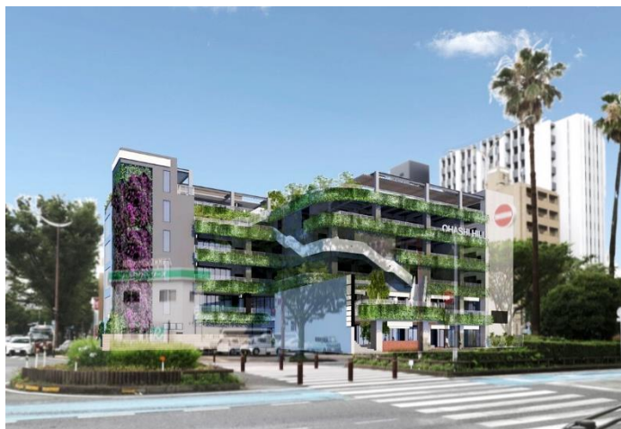
『OHASHI HILL』 建設予定地・建物外観イメージ