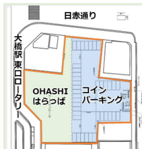
「えんホールディングス OHASHI PROJECT (仮称・OHASHI HILL) 建設予定地 MAP」