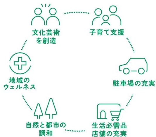
「えんホールディングス OHASHI PROJECT (仮称・OHASHI HILL) 「複合施設イメージ」と「構成する要素」